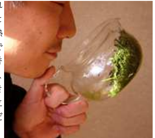
1煎目を入れた直後の茶葉のい〜香り