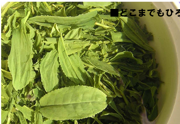
茶葉はここまでひらきます♪

3～4煎目まで飲み終わって、出がらしになった茶葉にさらにお湯をそそいでみてください。しばらくたつと、茶葉のよりが完全にもどり、春の茶畑ですくすくと育っていた新芽がそこにあらわれます。これも荒茶（あらちゃ）ならではの醍醐味！出がらしといっても、茶葉には、水に溶け出さない栄養成分（ビタミンEやβカロテンなど）が、たっぷり含まれています。春の新芽のみを使っているのだから、茶葉は、とってもやわらか。ぜひ「お茶がら」も召し上がって見てくださいね。